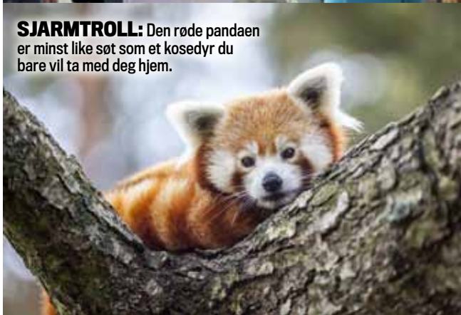
SJARMTROLL: Den røde pandaen er minst like søt som et kosedyr du bare vil ta med deg hjem.

den først og fremst er en dyrepark, virker det riktig å markere jubileet med en ny Bamseverden. Barnefamiliene strømmer til, og barnas øyne lyser av glede.