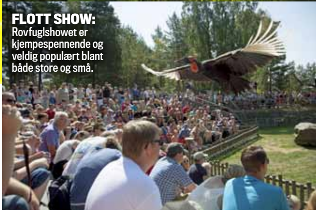
FLOTT SHOW: Rovfuglshowet er kjempespennende og veldig populært blant både store og små.