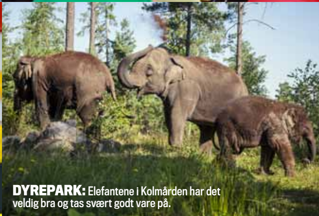
DYREPARK: Elefantene i Kolmården har det veldig bra og tas svært godt vare på.