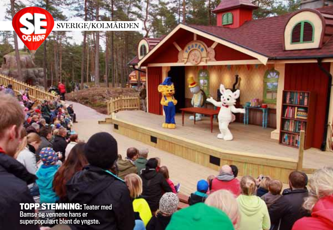
TOPP STEMNING: Teater med Bamse og vennene hans er superpopulært blant de yngste.