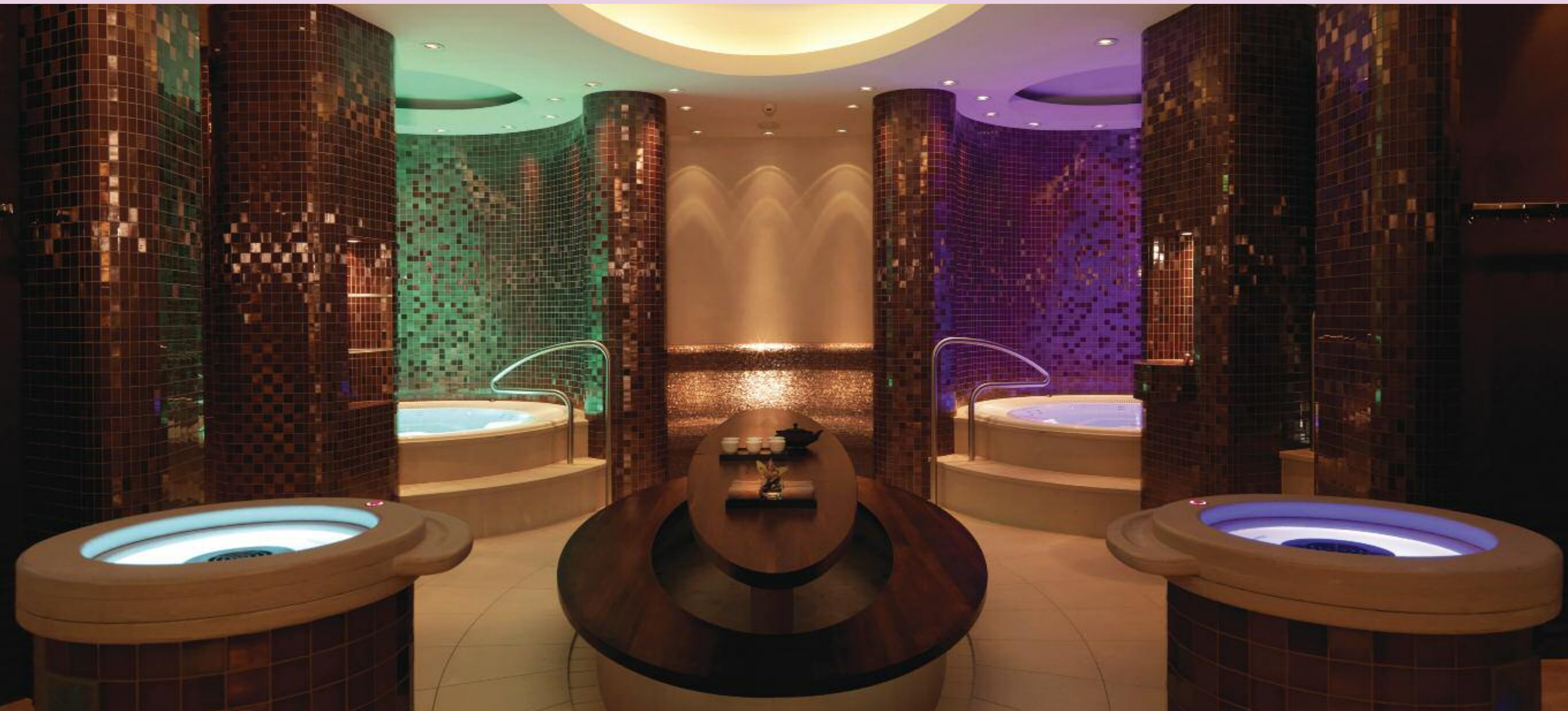
The Dolder Grand Spa, Zürich