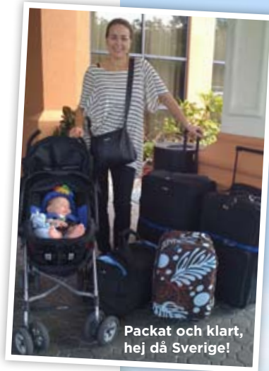
Packat och klart, hej då Sverige!

AV HEIDI ROVÉN