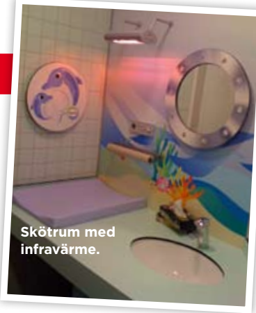
Skötrum med infravärme.

rastplatserna dyker upp. Vi hade en bilkyl som även kunde slås om till värmande läge som vi förvarade öppnad baby mat i.